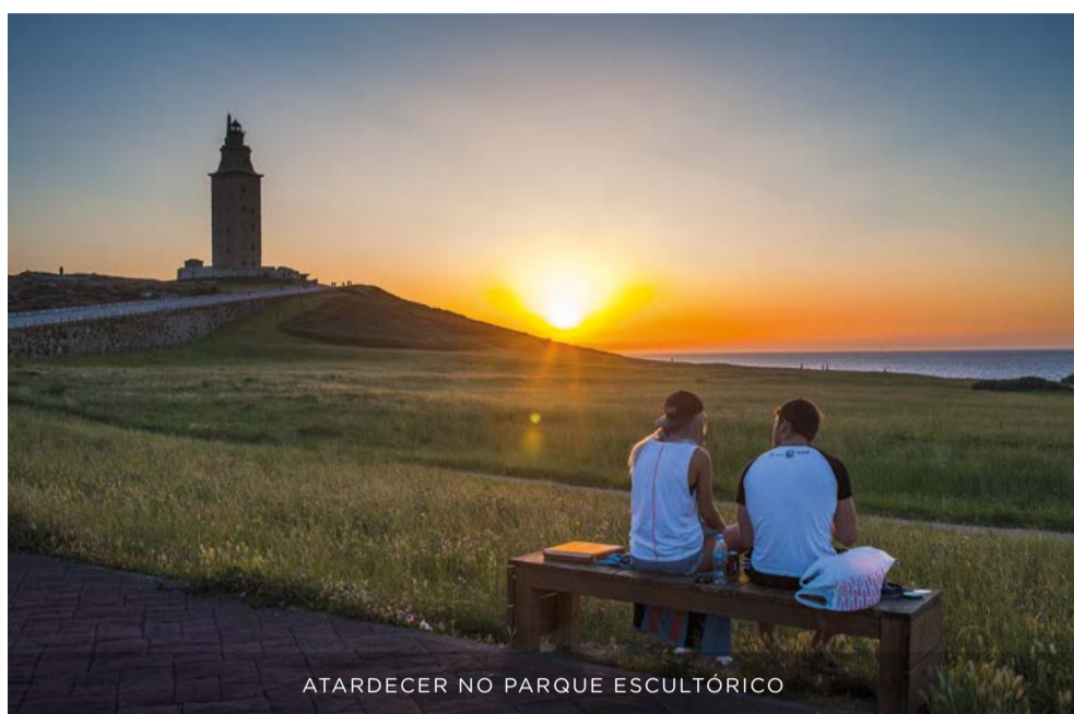
ATARDECER NO PARQUE ESCULTÓRICO