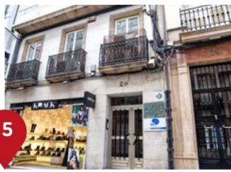
Real, 20 Real, 20 En febreiro de 1895, Picasso realizou a súa primeira exposición no número 20, no que entón era unha tenda de mobles. Recibiu dúas críticas excelentes na prensa tras mostrar diversos estudos de cabeza. En marzo fixo a segunda nesta mesma vía, crese que no número 54. Mostrou “El hombre de la gorra”, que hoxe conserva o Museo Picasso de París.

Picasso pintou “A Torre de Hércules” ao óleo nunha táboa. Tamén a debuxou nun dos periódicos manuais que fixo na Coruña: nese caso, presentouna sobre un prato e bautizouna como “Torre de caramelo”. Así é coma a chamaba seu pai, en alusión á cor do granito que a reviste desde o século XVIII. Moitos anos despois de marchar, Picasso recordaba as parellas que, non con intencións paisaxísticas, frecuentan aquel lugar apartado.