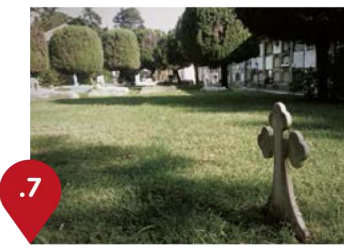
Cemiterio de Santo Amaro Orillamar s/n A irmá pequena de Pablo, Conchita, morreu de difteria o 10 de xaneiro de 1895. Dous días despois, foi sepultada na terra no cemiterio xeral (hoxe Santo Amaro), na zona de párvulos do primeiro departamento, de onde os seus restos foron seguramente retirados anos despois. Neste camposanto foron enterrados tamén o seu mecenas Pérez Costales, os seus profesores Brocos e Navarro e o tamén pintor Pardo Reguera. As tumbas dos tres últimos aínda se poden visitar.