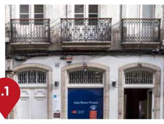
Casa-museo Picasso Paio Gómez, 14 T 981 189 854 / T 010 (chamadas locais) www.coruna.gal/cultura

Praia de Orzán de Picasso. A Coruña, 1895. (.3)