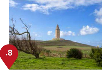
Torre de Hércules Doutor Vázquez Iglesias, s/n. Tlf: 981 223 730 torredeherculesacoruna.com

Picasso pintou “A Torre de Hércules” ao óleo nunha táboa. Tamén a debuxou nun dos periódicos manuais que fixo na Coruña: nese caso, presentouna sobre un prato e bautizouna como “Torre de caramelo”. Así é coma a chamaba seu pai, en alusión á cor do granito que a reviste desde o século XVIII. Moitos anos despois de marchar, Picasso recordaba as parellas que, non con intencións paisaxísticas, frecuentan aquel lugar apartado.