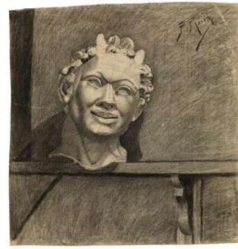
Academia de Picasso. A Coruña, 1895. (.2)