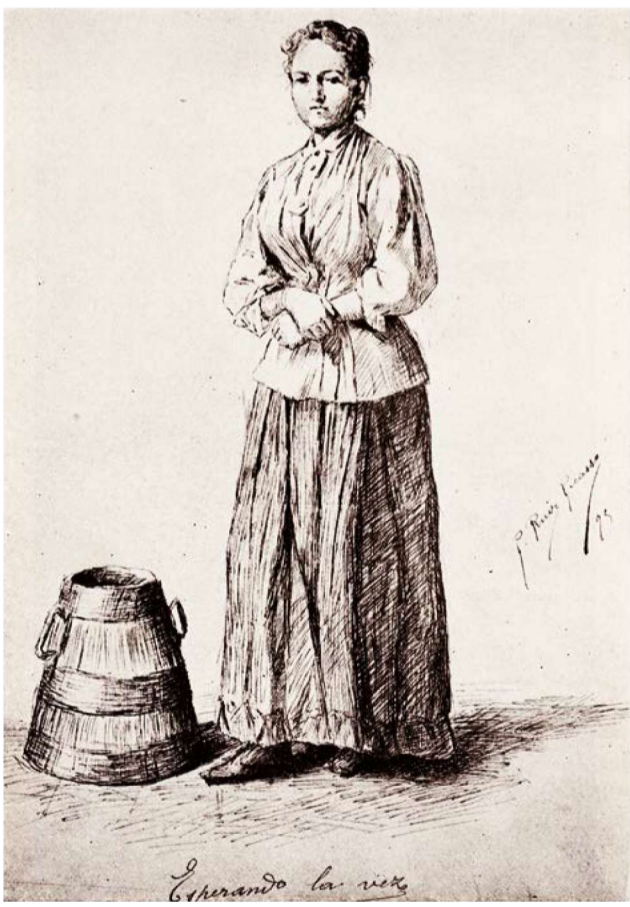
Esperando a vez de Picasso. A Coruña, 1895.