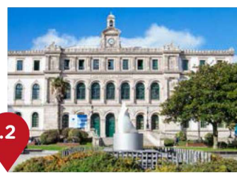
Plaza de Pontevedra Plaza de Pontevedra O Eusebio da Guarda, hoxe instituto, é o mellor caso de Picasso estudou ensinanza secundaria, con malas notas, e Belas Artes, con excelentes cualificacións. No primeiro andar deste edificio, recibiu durante tres cursos clases de artistas coma seu pai, Román Navarro ou Isidoro Brocos. Ademais, aquí realizou as súas primeiras exposicións colectivas. Na praza exterior, o neno xogaba aos touros cos seus compañeiros, para o que usaban as chaquetas como muletas.

En outubro de 1891, a familia Ruiz Picasso, procedente de Málaga, instalouse no segundo piso do número 14 da rúa Paio Gómez, onde vivirán até abril de 1895. É unha casa coruñesa de arquitectura típica, con galerías de madeira e na que se mantén a estrutura orixinal. Neste piso, o Concello da Coruña recreou unha vivenda do século XIX onde se poden ver reproducións da obra coruñesa de Picasso, así como un gravado orixinal do artista e o mellor cadro de seu pai, un “Palomar” con nove aves. Conta a lenda que, como seu pai estaba perdendo vista, as patiañas das pombas pintounas o neno.