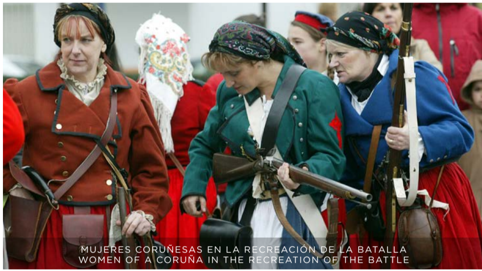
MUJERES CORUÑESAS EN LA RECREACIÓN DE LA BATALLA WOMEN OF A CORUÑA IN THE RECREATION OF THE BATTLE

If her spirit could talk, it would tell us that in addition to her romance with Moore, Lady Hester was one of the great travellers of the Georgian era, despite the fact that it was an age when eccentricity amongst women was frowned upon. She travelled extensively throughout the Near and Middle East, where she spent the last 30 years of her life, hence her nickname ' Queen of the Desert '. She went down in history as being the first European woman to visit Damascus, the first white woman to enter the forbidden city of Palmyra and the first female traveller to live with the Beduins.