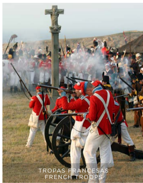
TROPAS FRANCESAS FRENCH TROOPS