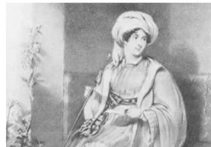
Lady Hester Stanhope, La Reina del Desierto

Cuentan crónicas de la época que esta noble británica, sobrina del primer ministro William Pitt, mantuvo una relación sentimental con el general Sir John Moore , fallecido en la batalla de Elviña un 16 de enero de 1809. Desde entonces, todos los años, ese mismo día Lady Hester viaja a Coruña para saludar al que fue amor de su vida. Cuentan que su silueta se pasea por el Jardín de San Carlos, donde yace Moore. De la nada de repente surge la misteriosa silueta de una mujer elegante, vestida de blanco, con el rostro cubierto por el ala de un gran sombrero. Su sombra camina lenta hasta la tumba de su amado donde se para y desaparece.