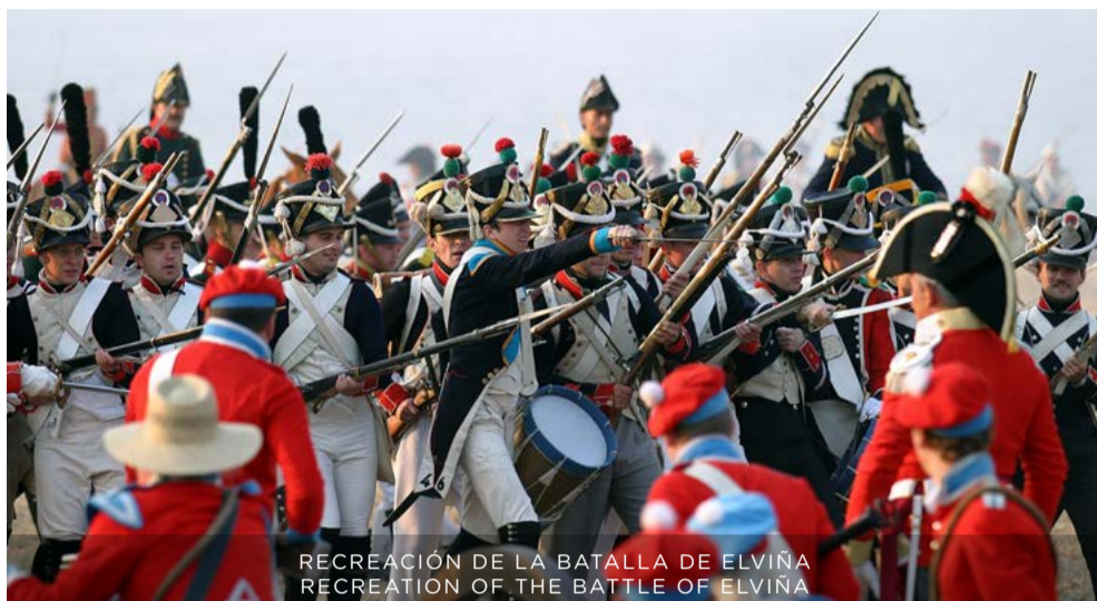
RECREACIÓN DE LA BATALLA DE ELVIÑA RECREATION OF THE BATTLE OF ELVIÑA

La Batalla de Elviña en las afueras de A Coruña, fue una de las más importantes de las libradas en Galicia durante la Guerra de la Independencia.