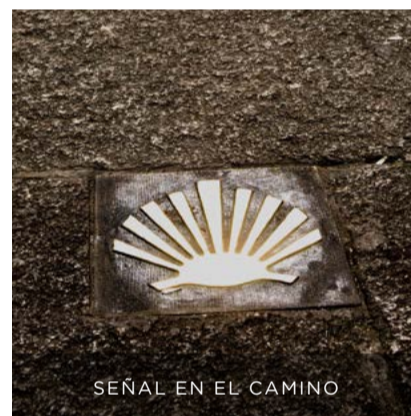
SEÑAL EN EL CAMINO

Su destino era casi sin excepción la ciudad de A Coruña, fundada en 1208. La elegían por su proximidad a Santiago, apenas a 75 km, y por los servicios que su puerto les ofrecía.