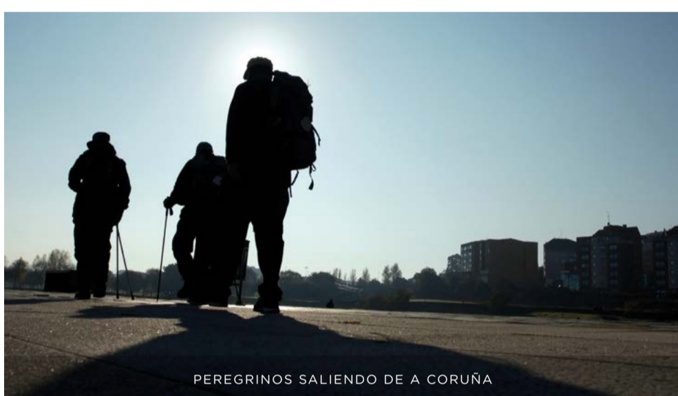
PEREGRINOS SALIENDO DE A CORUÑA

Al ser los ingleses los peregrinos más numerosos, este itinerario se conoció como Camino Inglés . En los años noventa del s. XX se recuperó para los peregrinos. La Catedral de Santiago concede la Compostela, el certificado de la peregrinación, a quien lo realice desde A Coruña en determinadas condiciones.