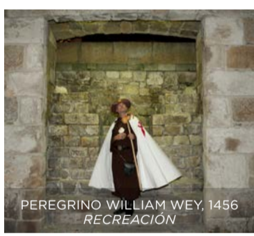
PEREGRINO WILLIAM WEY, 1456 RECREACIÓN

En A Coruña, como puerto de destino, este patrimonio dejó una huella intensa, conservada todavía en gran medida. Las iglesias de Santiago y Santa María o la desaparecida de San Jorge, varios hospitales e incluso parte de su disposición urbanística se ligan a este hecho.