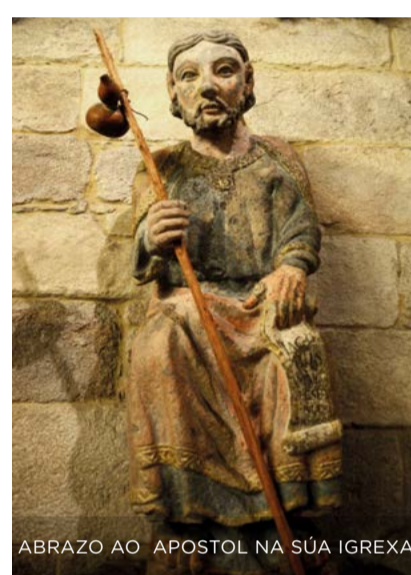
ABRAZO AO APOSTOL NA SÚA IGREXA

Certas tradicións sinalan que o apóstolo Santiago o Maior predicou no extremo occidental da actual Galicia, considerada no s. I polos romanos a fin do mundo. No s. IX descubriuse nestas terras o que se considerou o seu sepulcro.