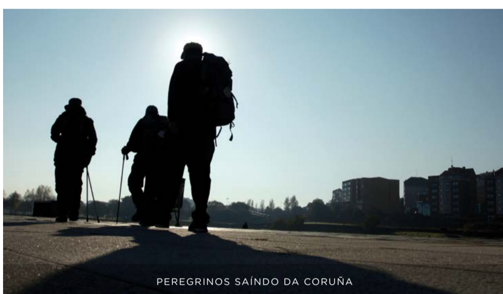
PEREGRINOS SAÍNDO DA CORUÑA

Ao ser os ingleses os peregrinos máis numerosos, este itinerario coñeceu-se como Camiño Inglés . Nos anos noventa do s. XX recuperouse para os peregrinos. A Catedral de Santiago concede a Compostela, o certificado da peregrinación, a quen o realice desde A Coruña en determinadas condicións.