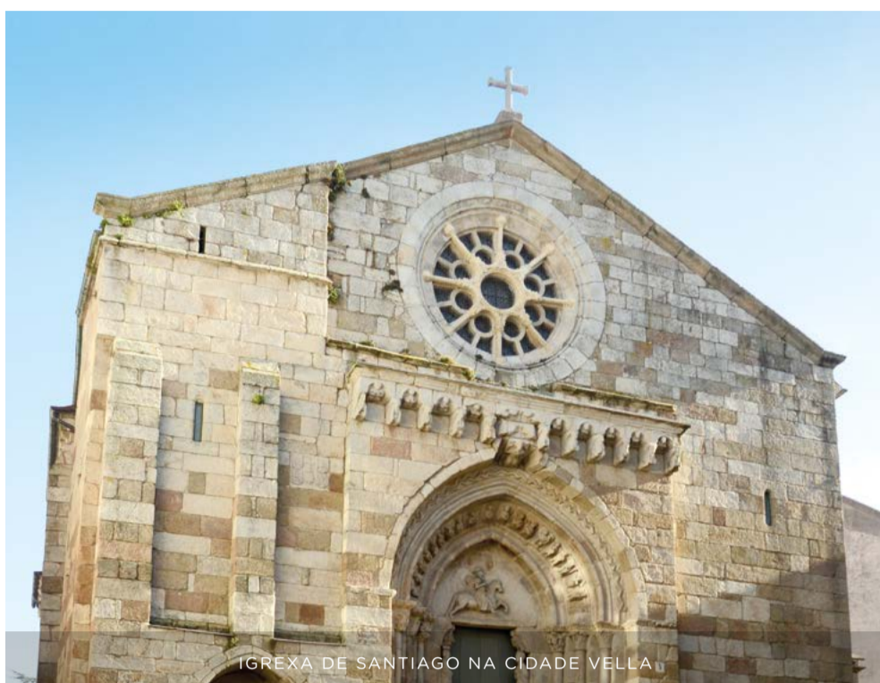
IGREXA DE SANTIAGO NA CIDADE VELLA