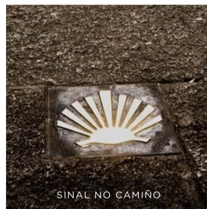
SINAL NO CAMIÑO

O seu destino era case sen excepción a cidade da Coruña, fundada en 1208. Elixíana pola súa proximidade a Santiago, apenas a 75 km, e polos servizos que o seu porto lles ofrecía.