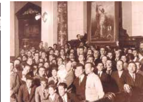
El pueblo y la República en el salón de plenos del Ayuntamiento coruñés.

Es necesario hacer ciudadanos, hombres libres que vayan detrás de una idea y no de un hombre.