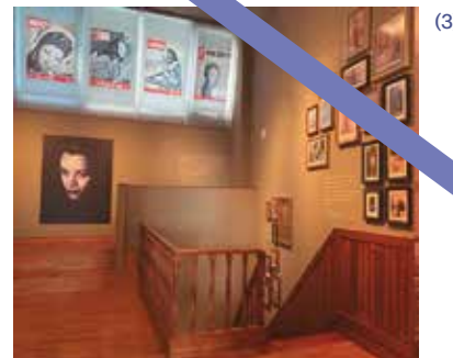
Vista de la tercera planta dedicada íntegramente a María Casares.

Exposición celebrada durante el centenario de María Casares. Sala de exposiciones temporales.