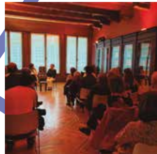
Actividades en la biblioteca de la segunda planta.