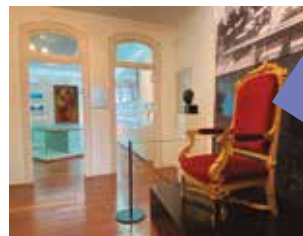
Detalle del sillón de Azaña y busto de Casares Quiroga en la primera planta.