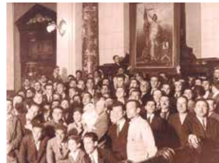
O pobo e a República no salón de plenos do Concello coruñés.

O primeiro que hai que combater é o escepticismo.