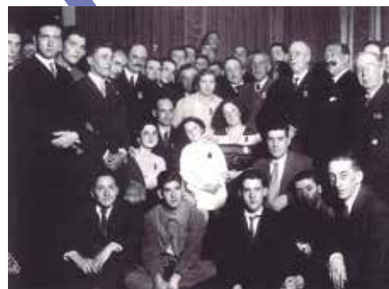
A familia Casares Quiroga rodeada de amizades no salón biblioteca. 28-3-1931.

É necesario facer cidadáns, homes libres que vaian detrás dunha idea e non dun home.