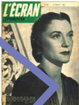
María Casares, 1926.

L'Écran français, nº 263. 17 de xullo de 1950.