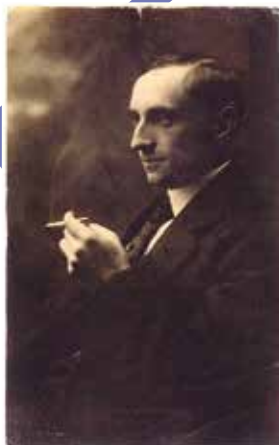
Santiago Casares Quiroga, 192. C-44903/115.

Ondeando a bandeira republicana no balcón do Concello da Coruña. Fotografía 3825.