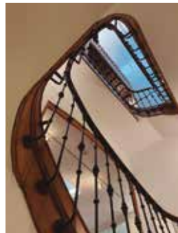
Escaleira de acceso ao museo.

A terceira planta está dedicada integramente a María Casares.